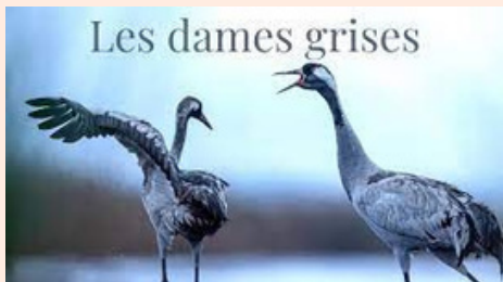
Les Dames Grises, 2023, 15', Léa Collober

Le court-métrage sur « Les Dames grises » a été présenté le 29 octobre 2023 au Festival international du film ornithologique de Ménigoute. Une immersion dans le marais de la Réserve Naturelle Nationale Etang de Cousseau à la découverte des grues cendrées.