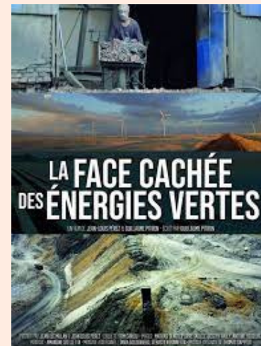
La face cachée des énergies vertes, 2020, 88', Jean-Louis Perez, Guillaume Pitron

Technologies vertes mais polluantes, recyclage impossible... : cette vaste enquête menée à travers le monde révèle les effets pervers des solutions propres pour parvenir à la transition énergétique.